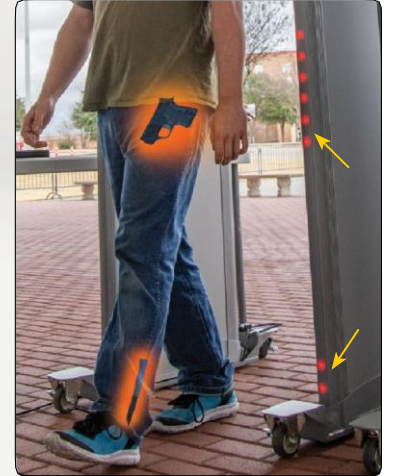
Sağ: Birden fazla hedef aynı anda parlak LED bölge göstergeleriyle gösterilir.

Sistem yükseltmelerine izin vermek için programlanabilir alan. Çevreye rüzgâr, yağmur ve toza karşı koruma. IR uzaktan kumandası (kolay ayarlamalar için) ve tekerlek takımları (üniteyi taşınabilir yapmak için) gibi eksiksiz aksesuar öğeleri dizisi.